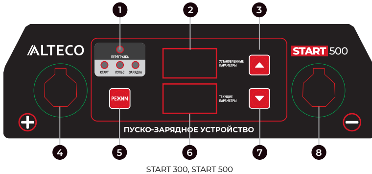
START 300, START 500